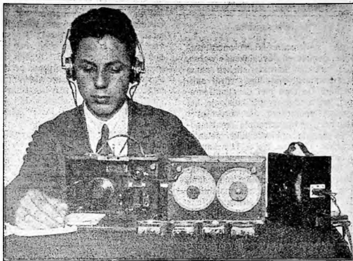
Van een kleine antenne en dito ontvangtoestel.

Ik heb WGY, „the Broadcasting station of the General Electric Co., New-York” verschillende nachten uit-